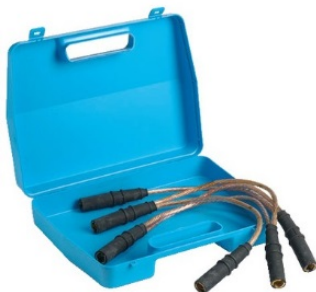
Рис.1. Устройство для закорачивания М6D

*Изготовитель оставляет за собой право вносить изменения в конструкцию и комплект поставки, не ухудшающие его характеристик.